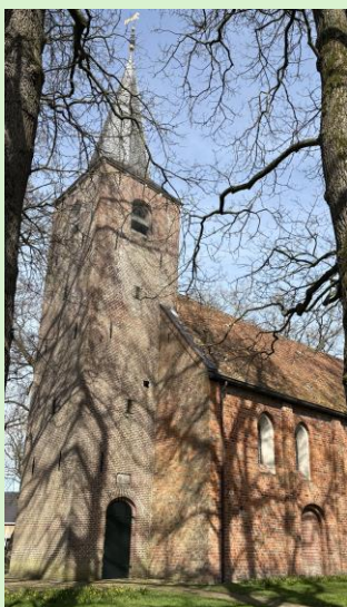
Foto: St. Hinsz-orgel te Roden