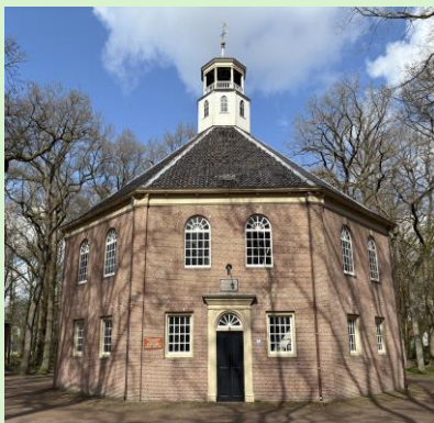
Foto: St. Hinsz-orgel te Roden

In 1825 werd bij koninklijk besluit een bedrag van fl.20.693,00 beschikbaar gesteld voor het bouwen van een Hervormde Kerk in Veenhuizen met apart staande pastorie. Er was plaats voor 612 mensen. De kerk werd gebouwd als Waterstaatskerk naar het voorbeeld van de Koepelkerk in Smilde en is uniek vanwege haar achtkantige koepel met inwendig koepelgewelf op Toscaanse zuilen en een rondgaande galerij.