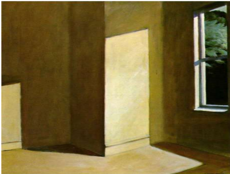
Sun in an empty room - Edward Hopper